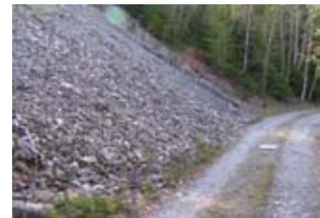
Sind das die Steine die von den Herzen fallen?